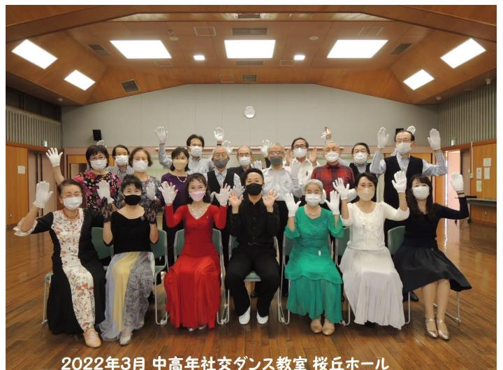
2022年3月 中高年社交ダンス教室 桜丘ホール

連絡先: 世田谷ウォーキングフォーラム 事務局 電話 080-1256-1524